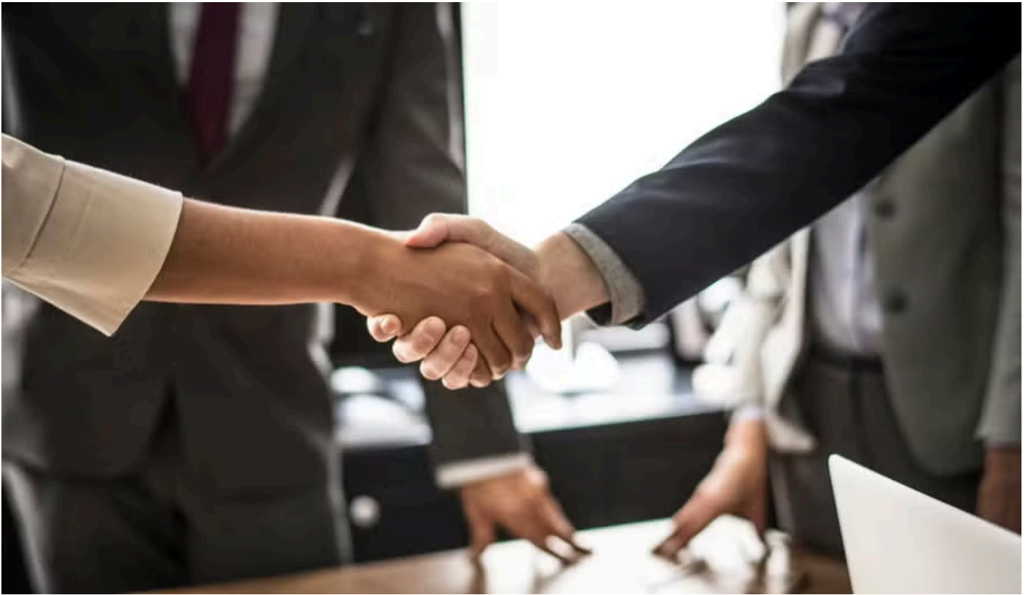
Vinci Partners fecha acordo para comprar MAV Capital

A Vinci Partners anunciou um acordo para aquisição da MAV Capital, gestora de recursos focada em fundos alternativos no segmento do agronegócio no Brasil, com aproximadamente R$ 550 milhões sob gestão. O valor do negócio não foi anunciado.