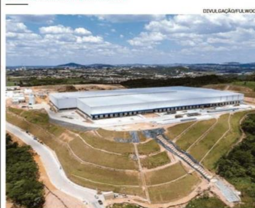
Fulwood acaba de inaugurar um galpão de 44 mil metros quadrados em Betim (MG) e espera alugá-lo completamente até o final do ano

Catarina. Para acelerar o crescimento, a ideia é fazer uma oferta inicial de ações (IPO, na sigla em inglês) de R$ 1 bilhão a R$ 1,5 bilhão, assim que houver apetite de investidores.